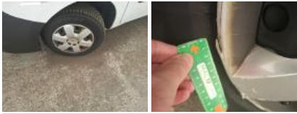
Enjoliveur de roue AVD, Cassé, E - Remplacer