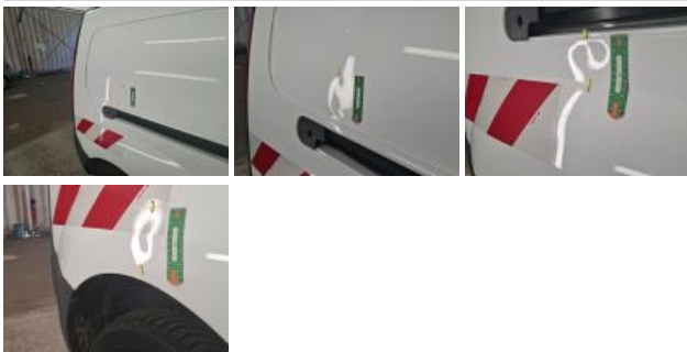
Porte coulissante D, Bosse(s), LI - Réparer et peindre (complet)