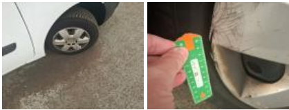
Panneau Latéral G, Bosse(s), LI - Réparer et peindre (complet)