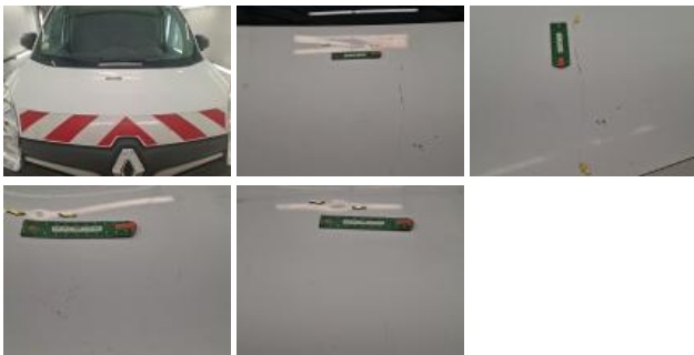
Panneau ARD, Bosse(s), LI - Réparer et peindre (complet)