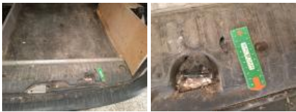
Pare-chocs AR, Déformé / Forcé, E - Remplacer