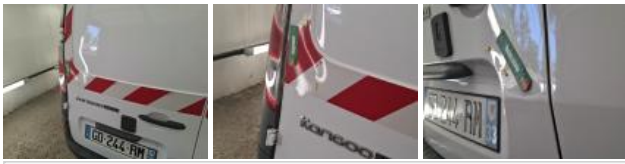
Feu ARD, Cassé, E - Remplacer