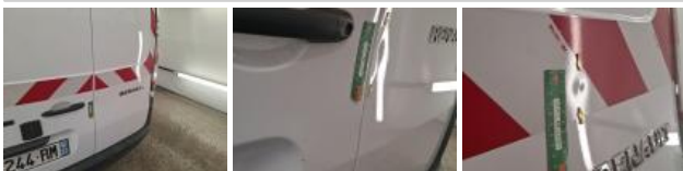
Porte de malle AR G, Bosse(s), LI - Réparer et peindre (complet)