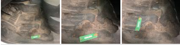
Enjoliveur de roue AVG, Cassé, E - Remplacer