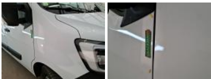
Porte coulissante D, Bosse(s), LI - Réparer et peindre (complet)