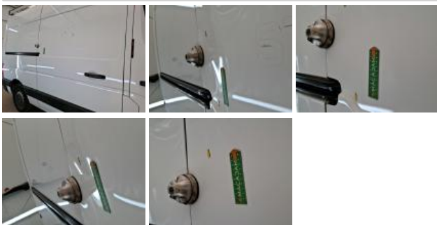
Moulure porte ARD, Griffe(s), Acceptable