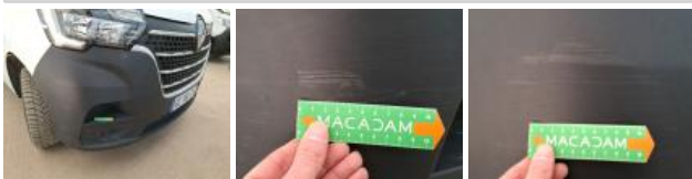
Aile AVD, Réglage, Ajuster