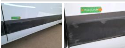
Moulure de panneau latéral D, Griffe(s), Acceptable